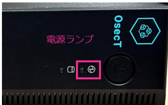
図. 電源ランプ消灯確認